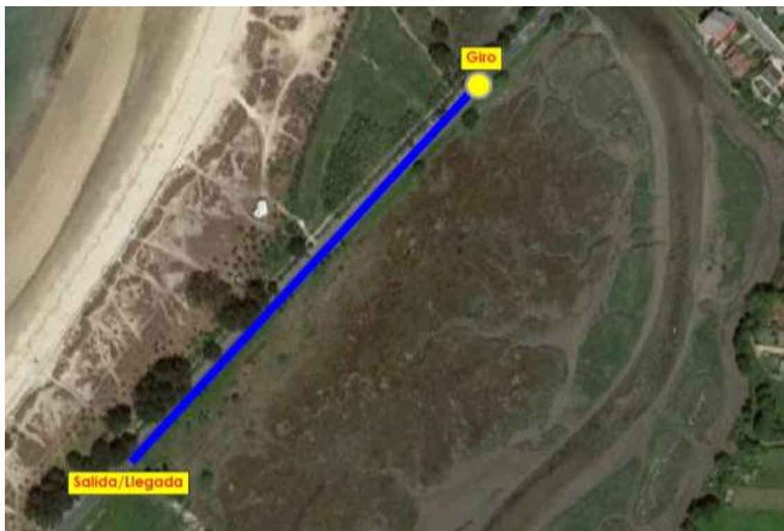
Imaxe 4. Percorrido Benxamins