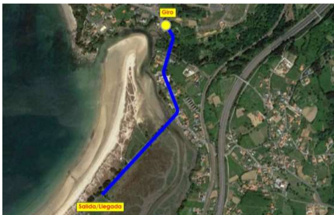
Imaxe 6. Percorrido Infantis