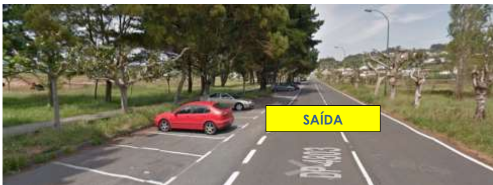
Imaxe 10. Saída da proba