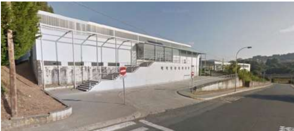
Imaxe 17. Pavillón Municipal de Deportes de Miño

Ao final das carreiras, os corredores dispoñerán de duchas e vestiarios no Pavillón Municipal do Deporte do municipio de Miño (en función do avance da pandemia) .