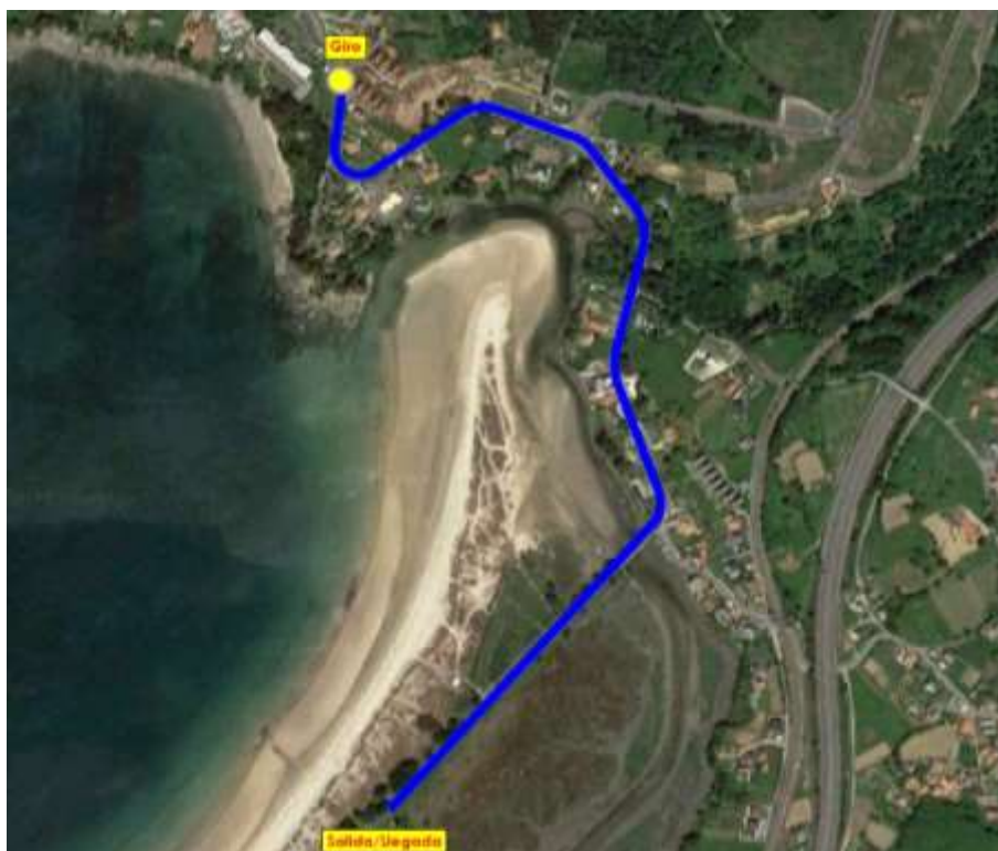
Imaxe 7. Percorrido Cadetes e Xuvenis