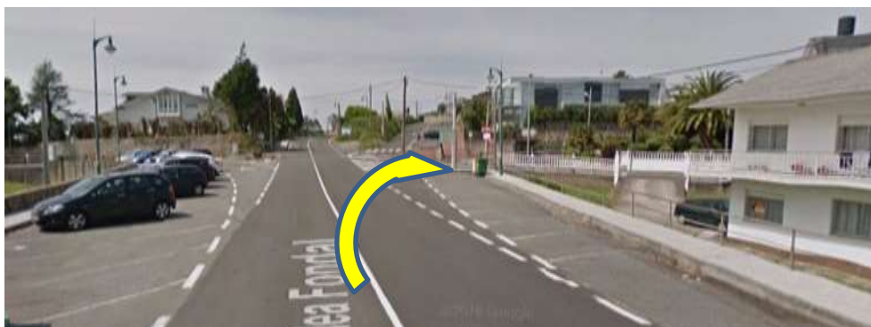
Imaxe 11. Cruce Praia Perbes (km 3)