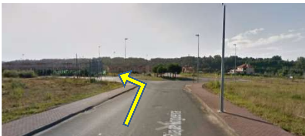
Imaxe 13. Cruce Costa Miño (km 5,400)