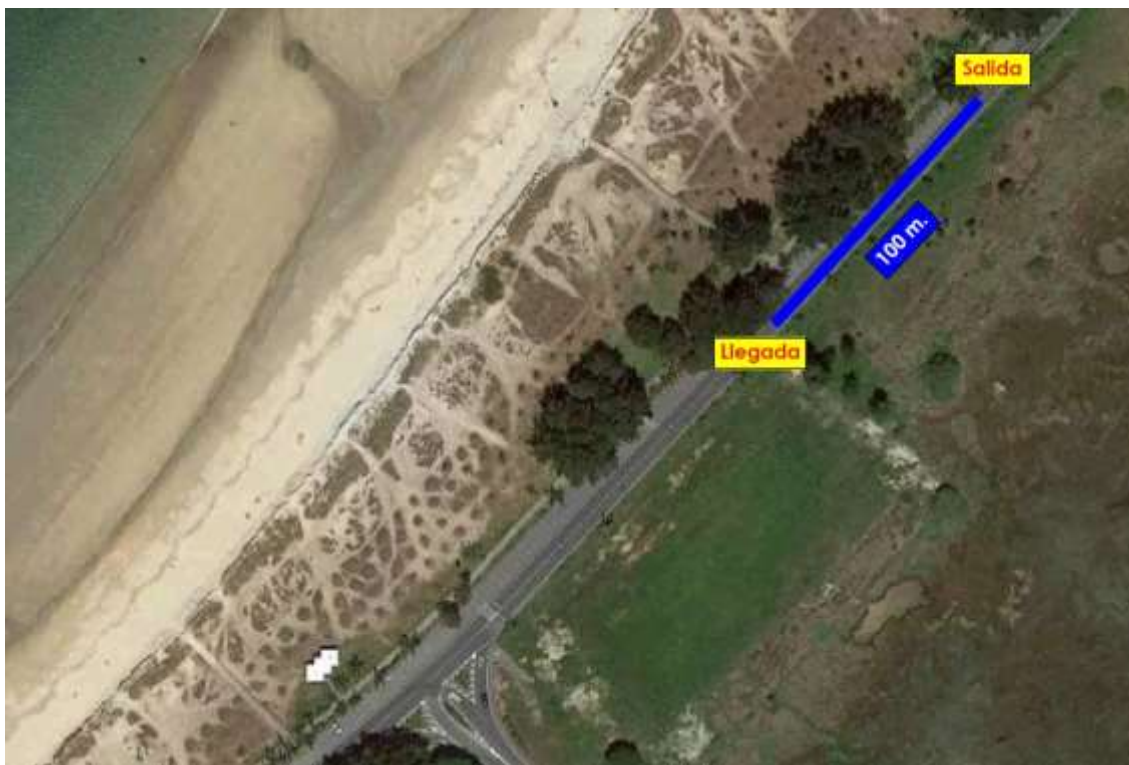
Imaxe 3. Percorrido Biberóns e Prebenxamins