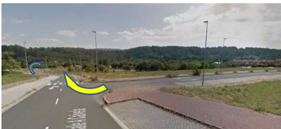
Imaxe 14. Xiros Costa Miño (km 6,500)