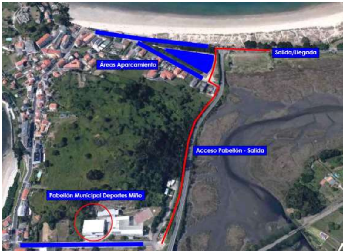
Imaxe 2. Áreas Disponibles

O circuïto discorre por asfalto e o acceso a el estará completamente pechado a todos os vehículos, agás os autorizados pola organización.