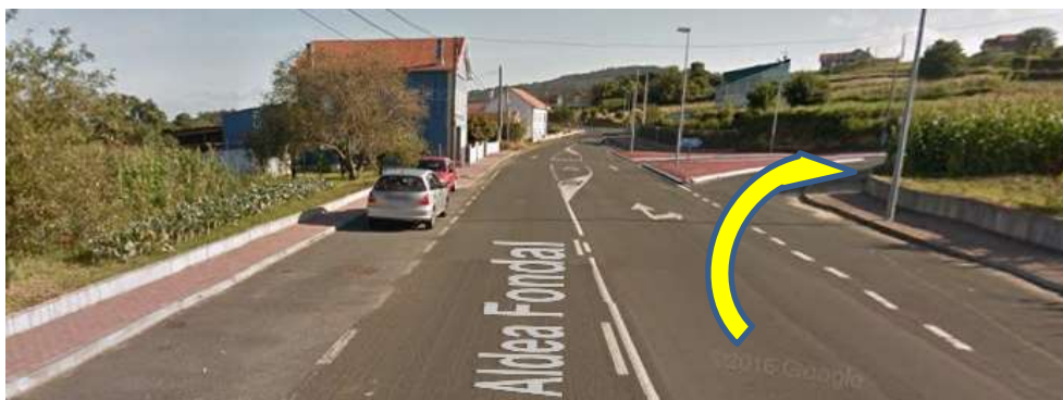
Imaxe 12. Cruce Entrada Costa Miño (km 4,800)