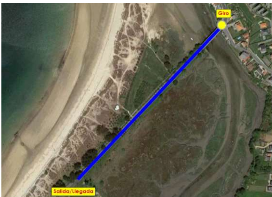
Imaxe 5. Percorrido Alevins