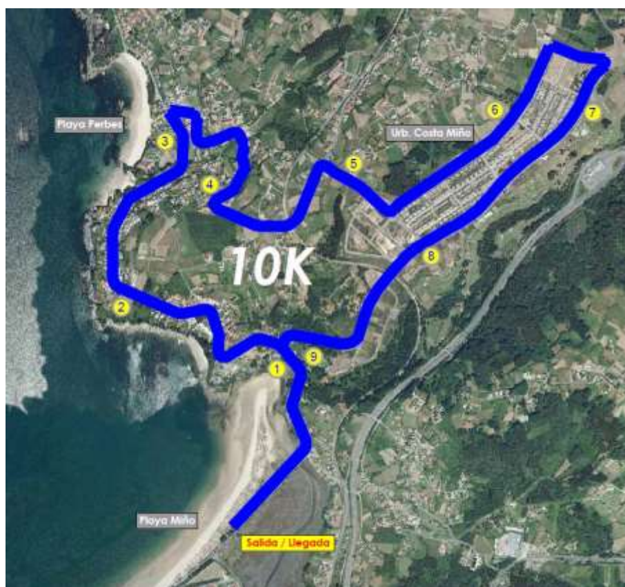
Imaxe 8. Percorrido e fitos quilométricos