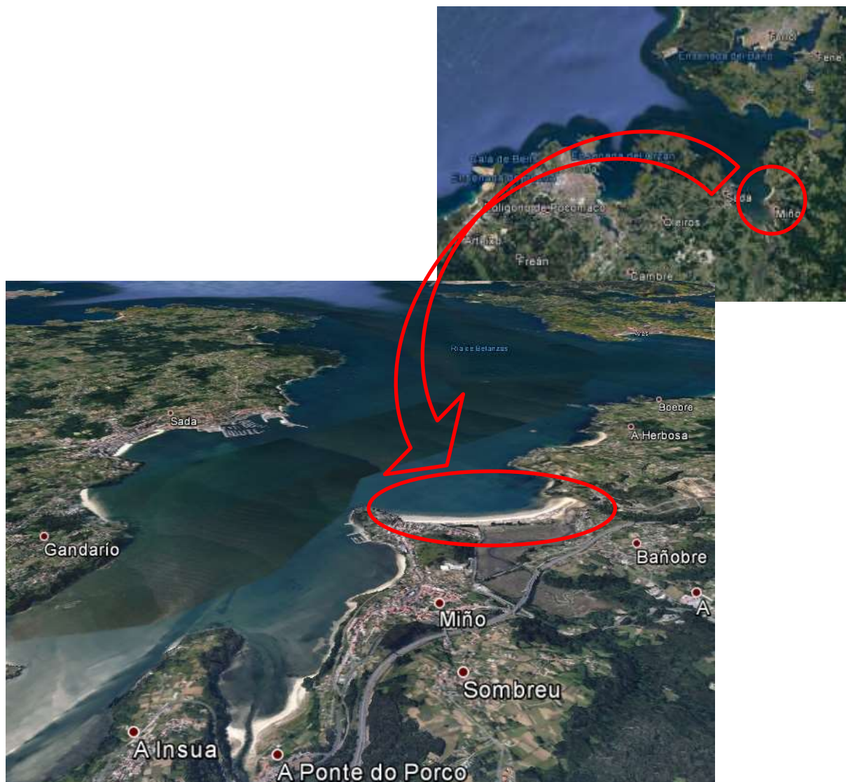
Imaxe 1. Praia de Miño (Concello de Miño)

A proba, tanto para as categorías menores como para a categoría absoluta, realizarase nas proximidades da praia de Miño, na costa do municipio de Miño.