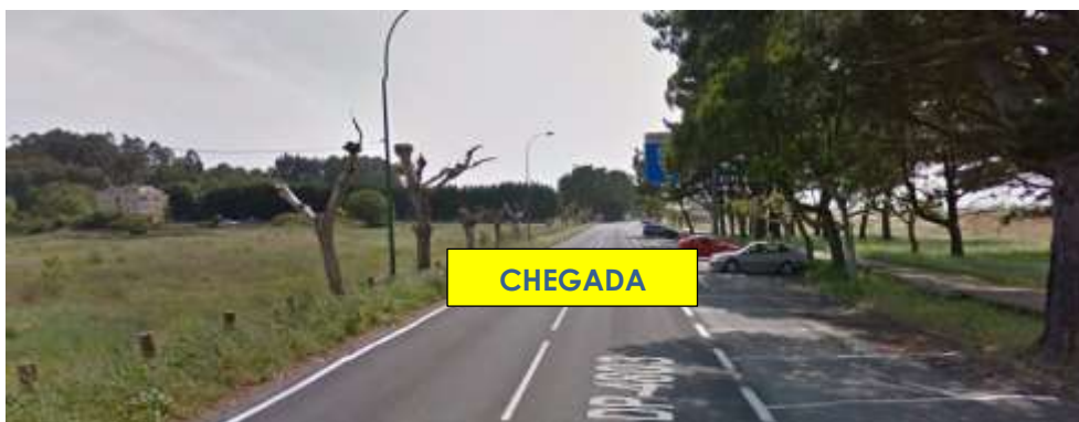
Imaxe 16. Chegada Praia Miño (km 10)