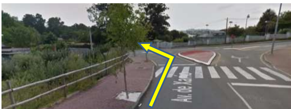
Imaxe 15. Saída Costa Miño (km 9)