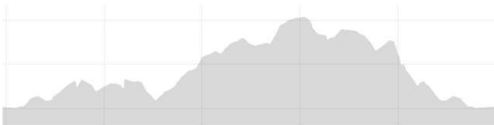
Imaxe 9. Perfil da carreira